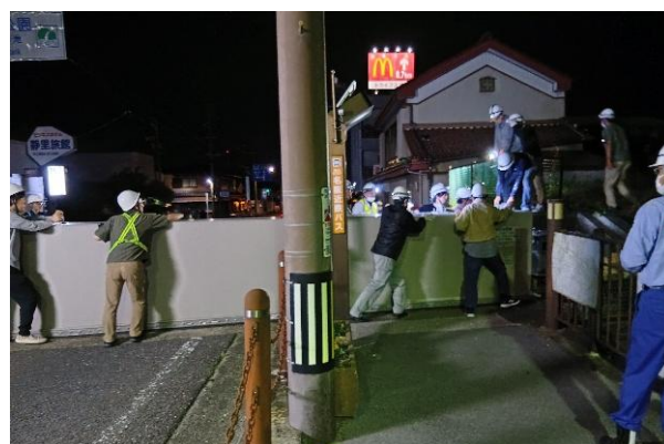
陸閘閉鎖状況(塩田橋右岸陸閘)