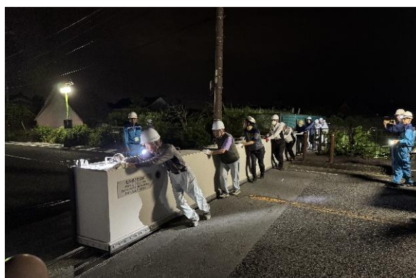
陸閘閉鎖状況(塩田橋左岸陸閘)