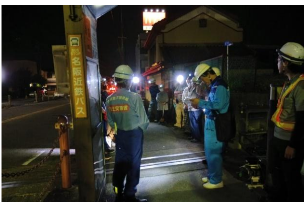
副所長の挨拶(塩田橋右岸陸閘)