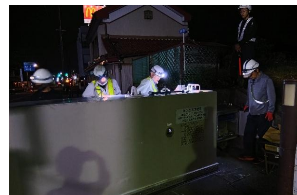
陸閘設備点検状況(塩田橋右岸陸閘)