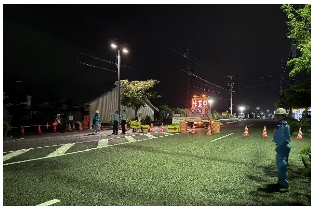
通行止め状況(塩田橋左岸陸閘)